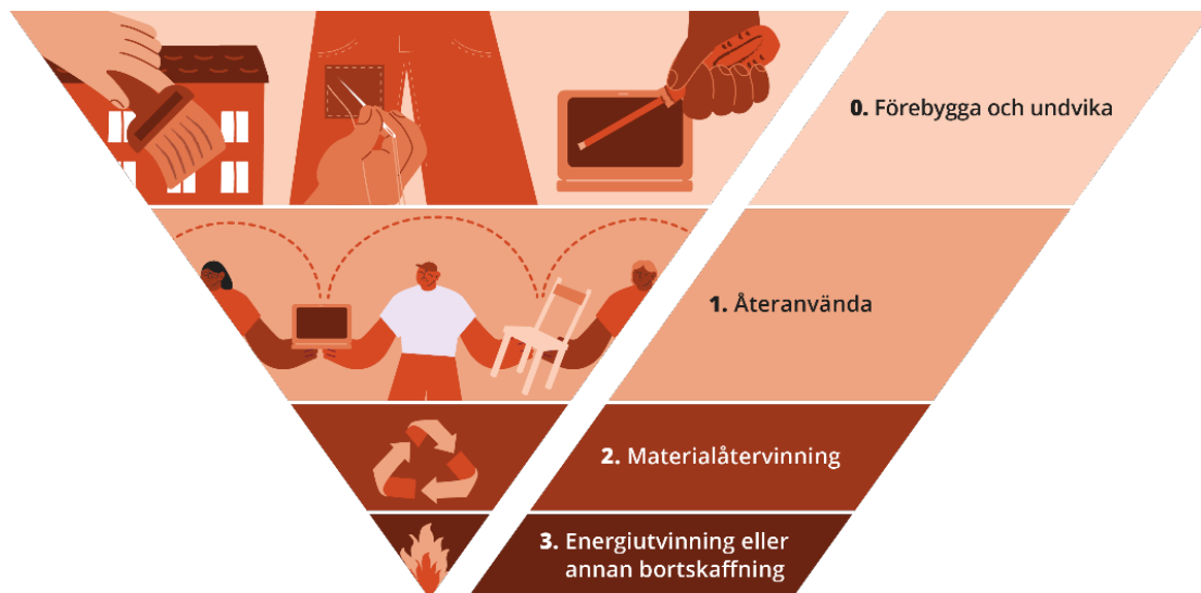
Figur 1: Illustration Göteborgs Stads prioriteringsordning för avyttring och bortskänkning

Kortfattat innebär ”Förebygga och undvika behovet av avyttring och bortskänkning” att bevara, underhålla och renovera befintlig lös egendom samt bygg- och markmaterial i den egna verksamheten. Det kan även innebära att minska behovet av avyttring redan vid anskaffning genom att till exempel minska inköpsvolymen, hyra vid tillfälliga behov och att efterfråga produkter och material med potential till lång livslängd.