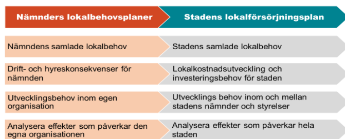
Figur 1. Skillnaden och kopplingen mellan nämnders lokalbehvsplaner och stadens lokalförsörjningsplan

Syftet med nämnders lokalbehvsplaner är att ge nämnderna en tydlig struktur för och analys av nämndens lokalbehvsplanering, kopplade till behov och utmaningar. Det innebär att nämnden ska redogöra för lokalbehov av befintliga, tillkommande och avgående lokaler. Förutom att leverera en analys av lokalbehov, aktuella utmaningar och möjligheter, lokalkostnadsutveckling och risker till respektive nämnd utgör nämndernas lokalbehvsplaner också underlag till stadens övergripande lokalförsörjningsplan. Stadens samtliga nämnder, genom respektive förvaltning, ansvarar för processen att ta fram nämndens lokalbehvsplan.