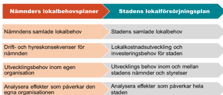
Figur 1. Kopplingen mellan stadens lokalförsörjningsplan och nämnders lokalbehovsplaner.

Syftet med nämnders lokalbehovsplaner är att ge nämnderna en tydlig struktur för och analys av nämndens lokalbehovsplanering, kopplade till behov och utmaningar. Det innebär att nämnden ska redogöra för lokalbehov av befintliga, tillkommande och avgående lokaler. Förutom att leverera en analys av lokalbehov, aktuella utmaningar och möjligheter, lokalkostnadsutveckling och risker till respektive nämnd utgör nämndernas lokalbehovsplaner också underlag till stadens övergripande lokalförsörjningsplan. Stadens samtliga nämnder, genom respektive förvaltning, ansvarar för processen att ta fram nämndens lokalbehovsplan.