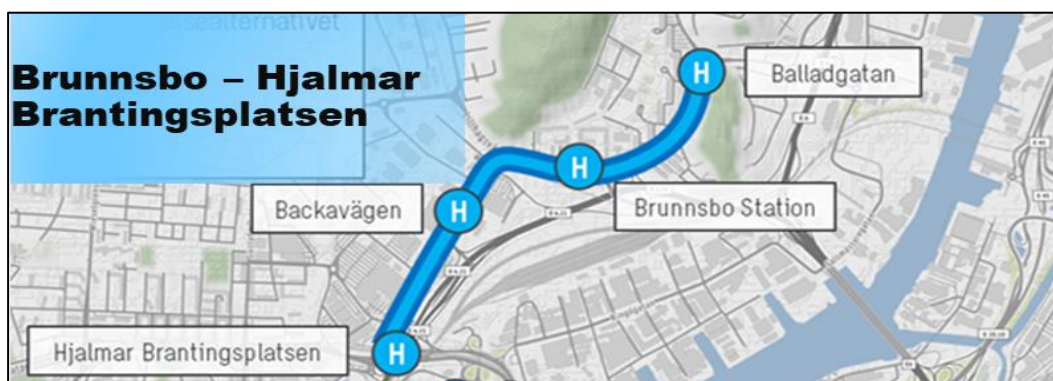
Figur 3 Översiktlig dragning med föreslagna hållplatser

Konceptet citybuss sammanfattas i Målbild Koll2035 som ”tänk spårvagn – kör buss”. Detta innebär att körvägar och linjenät ska vara stabila över tid precis som spårvagnsnätet och att den upplevda kvaliteten ska vara densamma. Det betyder att överallt där framkomlighet och komfort så kräver och det är möjligt, ska det finnas egna körbanor 2 .