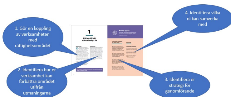
Bild: Implementeringsstruktur för varje nämnd och styrelse.

FO har under 2021 varit i direkt eller indirekt kontakt med alla nämnder och styrelser. Nämnderna har kontaktats via förvaltningsdirektörerna och bolagen via HR-chef eller hållbarhetschefer. Kontakten har berört implementering av programmet för full delaktighet i syfte att säkerställa att nämnder och styrelser uppfattat sitt uppdrag kopplat till programmet, identifiera utmaningar som berör den egna verksamheten, hitta tillvägagångssätt och strategier som de kopplar till egna aktiviteter samt identifiera samverkanspartners för att förstärka utfallet av egna och andras aktiviteter. De här fyra stegen av implementering finns beskrivna i bilden nedan. Då programmet berör 15–20 procent av invånarna i Göteborg är det av betydelse att samtliga nämnder och styrelser identifierar sin insats och bidrag.