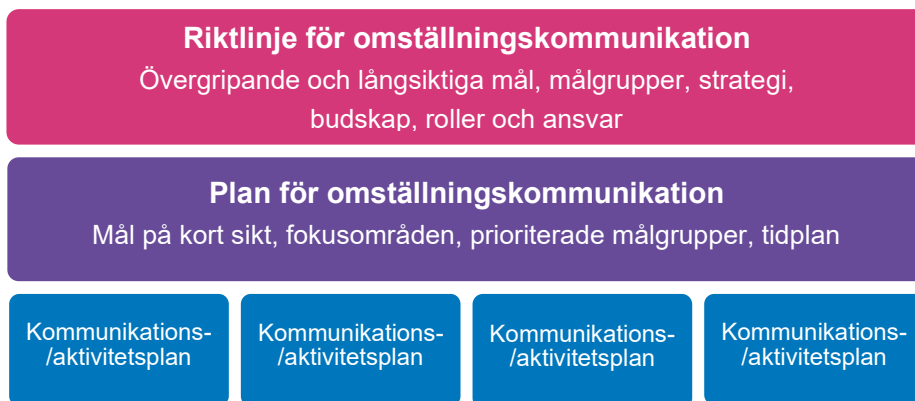
Figur 1: Riktlinjen kompletteras med en årlig plan för omställningskommunikation och mer detaljerade kommunikations- och aktivitetsplaner för särskilda projekt och satsningar.

Detaljerade kommunikationsplaner/aktivitetslistor kan efter behov därutöver tas fram för ett antal prioriterade projekt och satsningar.