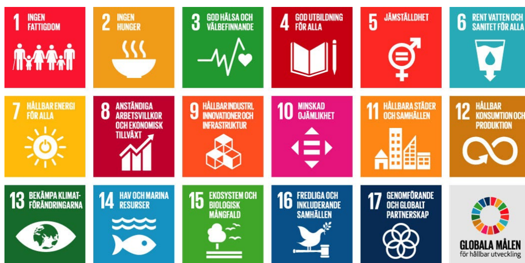
Figur 2. De 17 globala målen i Agenda 2030.

Eftersom det idrottspolitiska programmet spänner över många områden påverkar programmet ett större antal av de globala målen. Programmet bidrar med sina fyra mål framför allt till att uppfylla mål 1, 3, 4, 5, 8, 9, 10, 11 och 17.