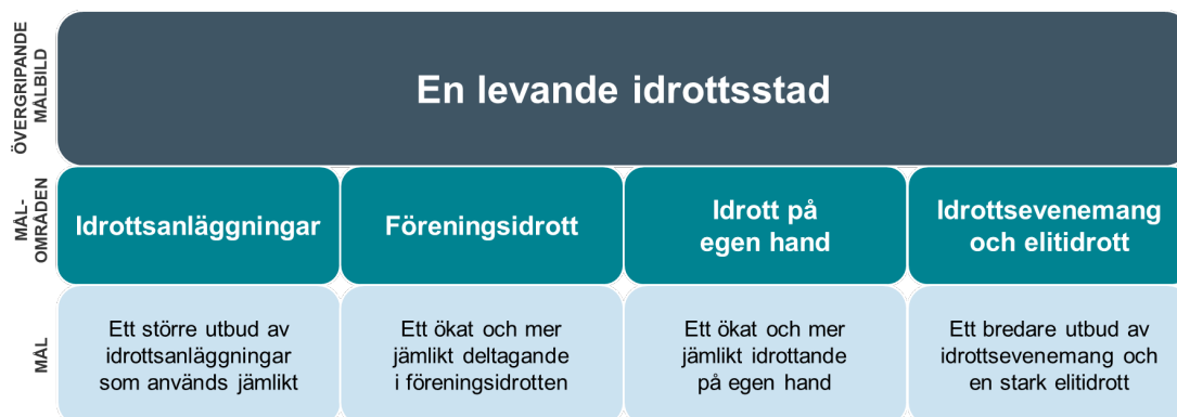
Figur 1. Programmets målstruktur.

Ett samordnat och fokuserat arbete från alla berörda aktörer gör att Göteborg år 2030 har fler personer, särskilt bland underrepresenterade grupper, som idrottar på egen hand och inom föreningsidrotten, som har möjlighet att göra en satsning inom en stark elitidrott och som samtidigt kan ta del av ett större och bredare utbud av idrottsanläggningar respektive idrottsevenemang.