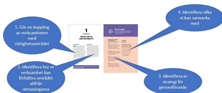
Bild: Implementeringsstruktur för varje nämnd och styrelse.

FO har under 2021 varit i direkt eller indirekt kontakt med alla nämnder och styrelser. Nämnderna har kontaktats via förvaltningsdirektörerna och bolagen via HR-chef eller hållbarhetschefer. Kontakten har berört implementering av programmet för full delaktighet i syfte att säkerställa att nämnder och styrelser uppfattat sitt uppdrag kopplat till programmet, identifiera utmaningar som berör den egna verksamheten, hitta tillvägagångssätt och strategier som de kopplar till egna aktiviteter samt identifiera samverkanspartners för att förstärka utfallet av egna och andras aktiviteter. De här fyra stegen av implementering finns beskrivna i bilden nedan. Då programmet berör 15–20 procent av invånarna i Göteborg är det av betydelse att samtliga nämnder och styrelser identifierar sin insats och bidrag.