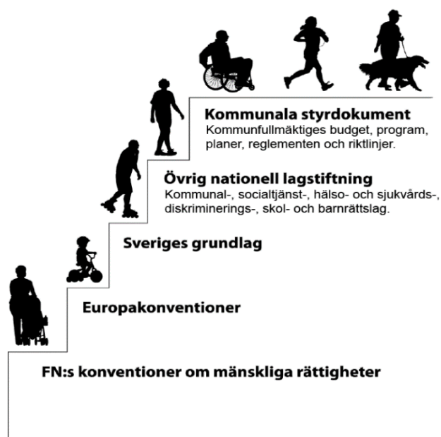
Fig. 2 Styrmedel mänskliga rättigheter, internationell till kommunal nivå. Källa: MR-avdelningen Stadsledningskontoret

grundsyn om mänskliga rättigheter och mot diskriminering. Ansvaret för att konventionerna, och lagarna, efterlevs på kommunal nivå handlar om förvaltningars och bolags förmåga att upprätthålla respekten för de mänskliga rättigheterna i det dagliga arbetet (fig. 2).