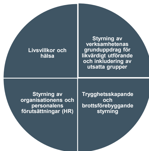
Figur: Fyra huvudsakliga områdena som styrmiljön för mänskliga rättigheter kan delas in i

Hela eller delar av de befintliga styrande dokumenten som ingår i utredningen har olika ingångar till hur de mänskliga rättigheterna ska värnas, skyddas och respekteras men har framför allt fokus på olika gruppers rättigheter och perspektiv. De styrande dokumenten som ingått i uppdraget har olika inriktningar. I figuren nedan illustreras de fyra huvudsakliga områdena som styrmiljön omfattar. Utformningen av den långsiktiga styrningen behöver beakta hur styrningen bäst fördelas inom dessa områden, det vill säga knyta ihop styrning av de frågor som tjänar på att verkställas på ett samordnat sätt.