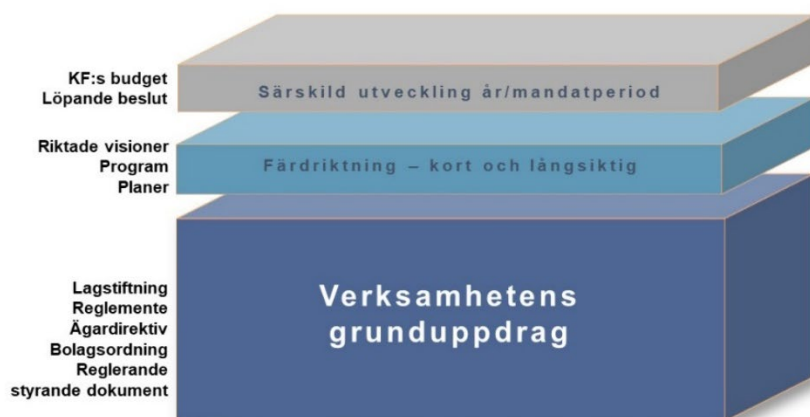
Figur: Olika kategorier av beslutad styrning ur ett verksamhetsperspektiv

Kommunfullmäktige kan även styra genom att efterfråga resultat via uppföljning eller begära in utvärderingar och andra typer av granskningar. Resultatet kan användas som underlag för nya beslut. Ett annat sätt att driva en fråga i förvaltningar och bolag är olika typer av samordning och stöd. Stadengemensamma stödresurser eller stödmaterial är formellt frivilliga att ta del av men kan påverka verksamheternas genomförande av styrningen i stor utsträckning.