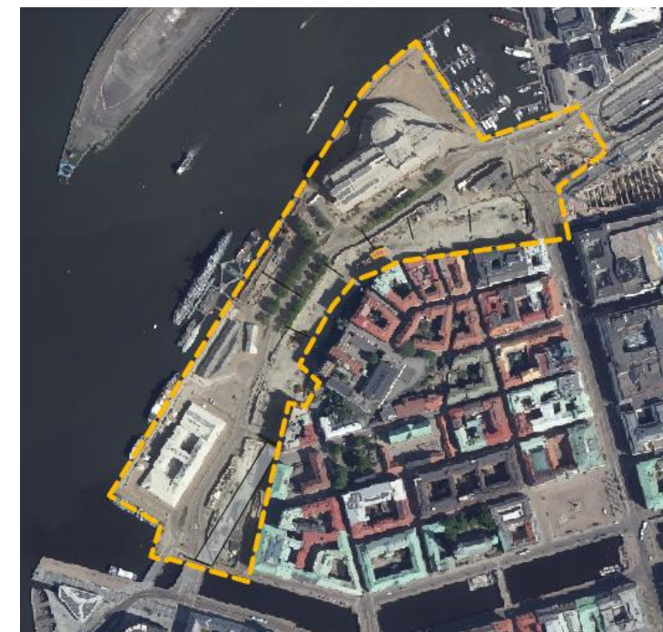
Översiktsskild över aktuellt område. Ungefärligt planområde markeras med gul linje