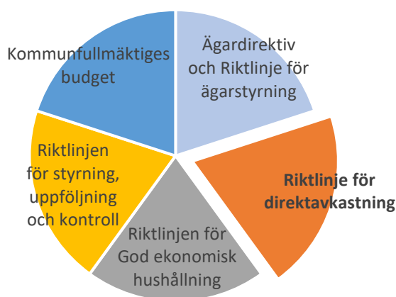
Figur 1 - Primära styrande dokument för finansiell styrning av Stadshuskoncernen

Riktlinjen beskriver grundläggande förutsättningar, principer, definitioner och gränsvärden som tillsammans skapar ett vägledande transparent regelverk för beräkning av direktavkastning från Stadshuskoncernen. Den ska användas som stöd och vägledning vid framtagande av stadens budget, där nivån för direktavkastning (utdelning och kapitaltillskott) sätts. Riktlinjen är avsedd att användas tillsammans med övriga styrande dokument, exempelvis kommunfullmäktiges budget och ägardirektiv som tillsammans möjliggör en aktiv styrning av Stadshuskoncernen.