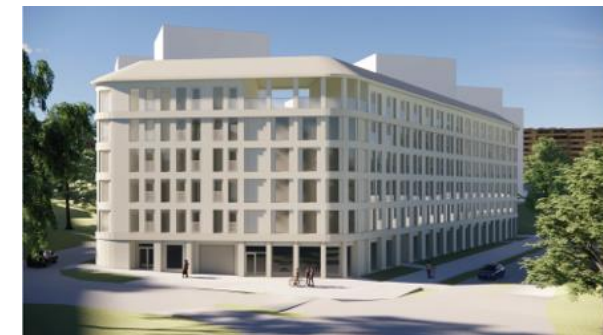
Förslag/volymstudie, kvarter med studentbostäder. Bild: What! arkitektur