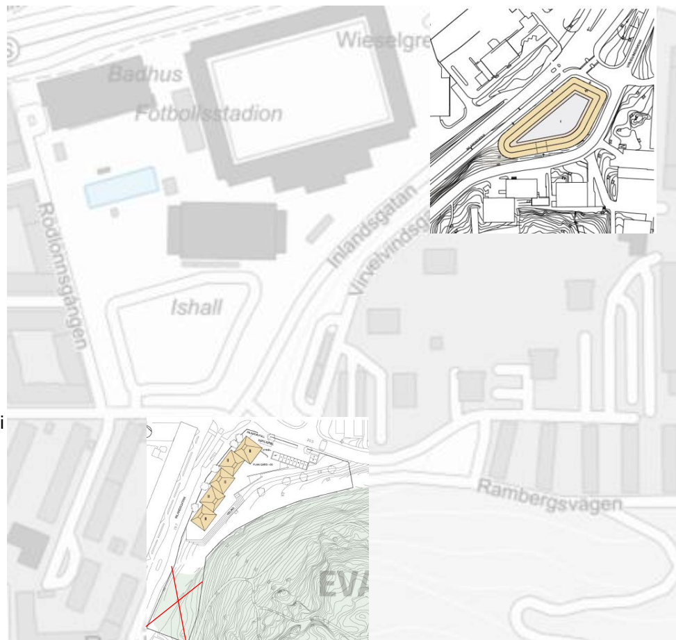
Illustrationsplaner inklistrade på stadskarta. Förskola i söder och studentbostäder i norr. Rödkryssad del av skisserad förskolegård föreslås utgå, för att bevaras som park och ev utvidgad park.