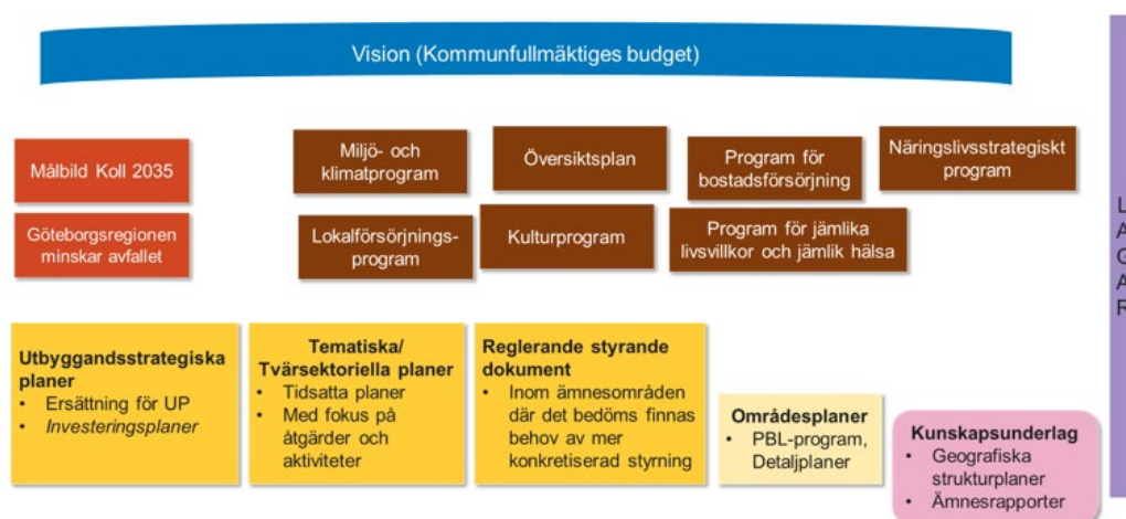
Illustration över stadsbyggnadsförvaltningens tolkning av den övergripande styrningen inom strategisk stadsplanering som en generell hållning till utvecklad struktur.

Utifrån stadsledningskontorets bedömning om vilka styrande dokument som är i behov av hantering på olika sätt har stadsbyggnadsförvaltningen i uppdraget behövt se på styrningen inom strategisk stadsplanering genom att vidareutveckla illustrationen av den av kommunfullmäktige beslutade strukturen för styrande dokument inom strategisk stadsplanering. Stadsbyggnadsförvaltningen har tolkat den övergripande styrningen inom strategisk stadsplanering till en generell hållning för utvecklad struktur. Detta genom värdering av vilka visioner, kommunala program och mellankommunala program som bedöms ha direkt påverkan på den strategiska stadsplaneringen samt vilka kategorier av konkretiserande styrning som bör tas fram inom strategisk stadsplanering.