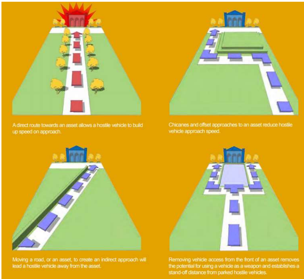
Figur 1 Exempel på utformning av gator för att minska risk för fordonsattacker, från CPNI - Integrated Security - A Public Realm Design Guide for Hostile Vehicle Mitigation - Second Edition https://www.cpni.gov.uk/system/files/documents/40/20/Integrated%20Security%20Guide.pdf