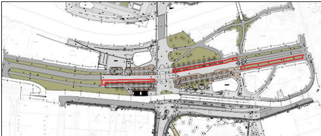
Bild 1. Möjliga placering av cykelparkeringar i anslutning till allén markerat med rött.

I Allén är de möjliga ytorna mellan träd och delvis på planerade grönytor. Ytorna mellan träden i allén kräver ytterligare utredning för att fastställa exakt antal platser då teknisk lösning är avgörande för att kunna säkerställa att träd inte tar skada. Ur trafiksäkerhetssynpunkt är flera av ytorna olämpliga då det finns trafiksäkerhetsrisker. Detta då det inte finns ytor för manövrering utan risk för kollision när cyklister backar ut med cykel i cykelbanan. Det föreligger även risk när användare angör cykelparkeringen då de behöver stanna och manövrera cykeln på cykelbanan. Vidare finns det även risker då det är svårt att uppnå hinderfri bredd både mot körbana och cykelbana.