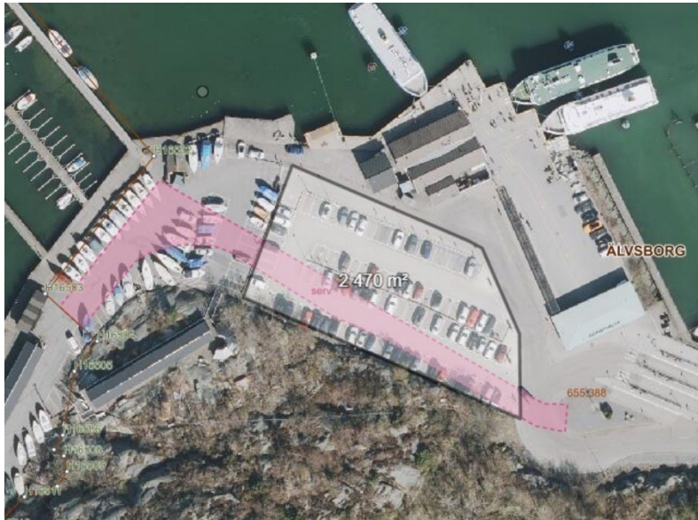
Figur 2. Föreslagen plats för parkeringshus intill färjeterminalen.

En ny båtuppställningsplats kan inte genomföras likt Grefabs nuvarande service eftersom bolagets dragbil (som placerar båtarna på sin respektive plats) inte får köras i allmän trafik. Lösningen ligger i stället i att använda bilkärror för att transportera båtarna på Saltholmsgatan.