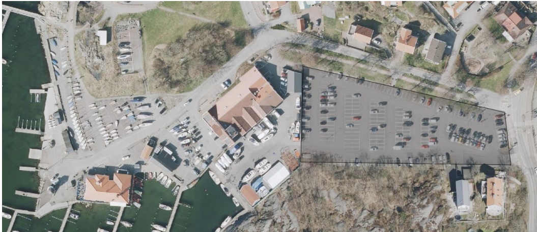
Figur 3. Översikt av Talattagatans parkering i anslutning till Göteborgs kungliga seglarselskaps samt Nimbus fastigheter.

Trafiknämndens beräkningar har utgått från att i första hand bibehålla samma servicenivå som Grefab idag erbjuder sina kunder. Dragbilen som behövs för att frakta båtar mellan upptagning och uppläggningsytan klassas inte som trafiksäker och kan inte medges dispens från trafikförordningen att köra på allmän väg.