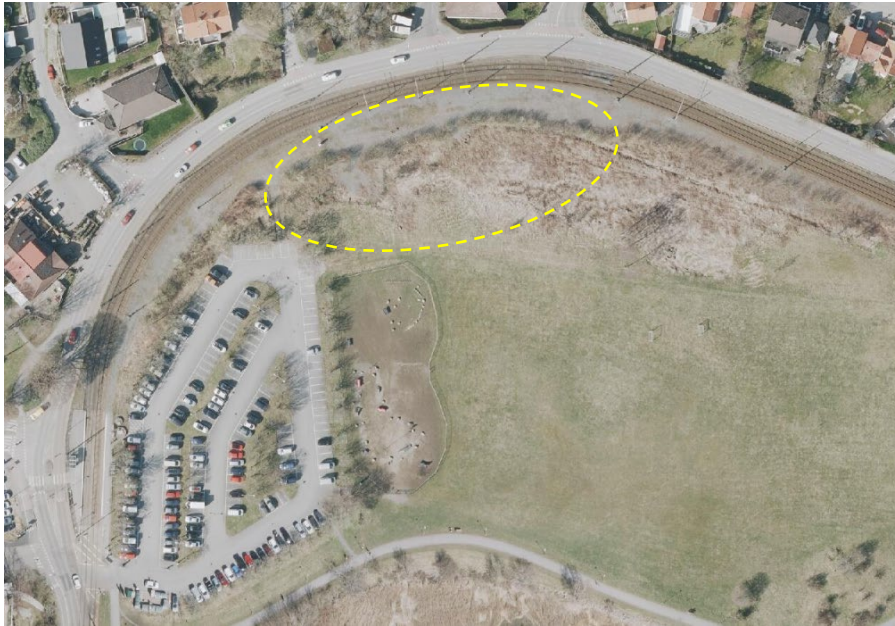
Figur 4. Befintlig parkeringsyta för besökare vid Vikebacken, med möjlighet till utbyggnad genom bygglovsansökan, se gul markering.

spårvägen behöver korsas för att svänga in vid Vikebacken kan inte alla olika typer av båtar placeras på Vikebacken, utan bara de som kommer in mellan spåret och elledningarna.