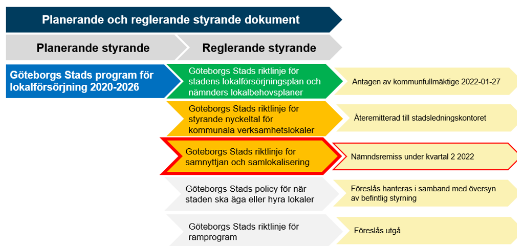
Figur 1: Göteborgs Stads program för lokalförsörjning 2020–2026

Kommunfullmäktige antog 2020-03-19 § 4, dnr 1006/18, Göteborgs Stads program för lokalförsörjning 2020–2026. Genom programmet har kommunfullmäktige beslutat att nya reglerande styrande dokument ska tas fram i syfte utveckla stadens lokalförsörjningsprocess: