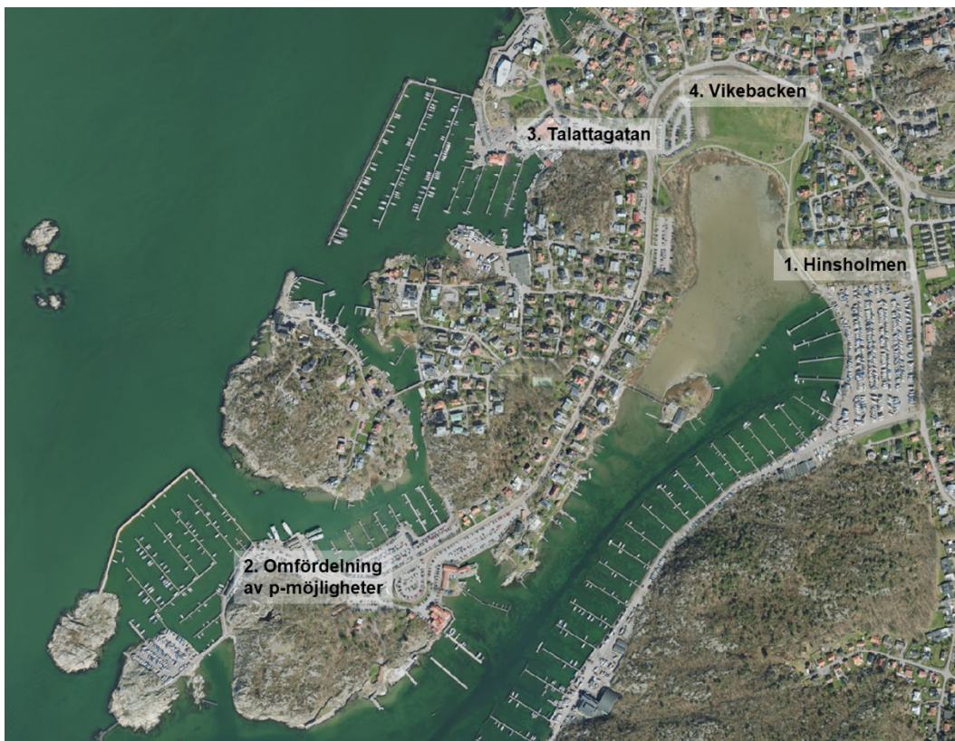
Översiktsbild lokalisering av trafiknämndens fyra alternativ.