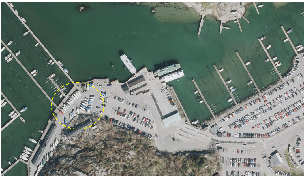
Figur 1. Båtuppställningen väster om färjeterminalen vid Saltholmen.

Alternativen har studerats och beräknats översiktligt och vid en eventuell vidare hantering av något alternativ behövs en mer omfattande utredning tas fram med fokus på genomförbarhet och kostnad. En summering av alternativ och ekonomisk kalkyl ses i tabellen nedan. Varje alternativ beskrivs utförligt därefter.