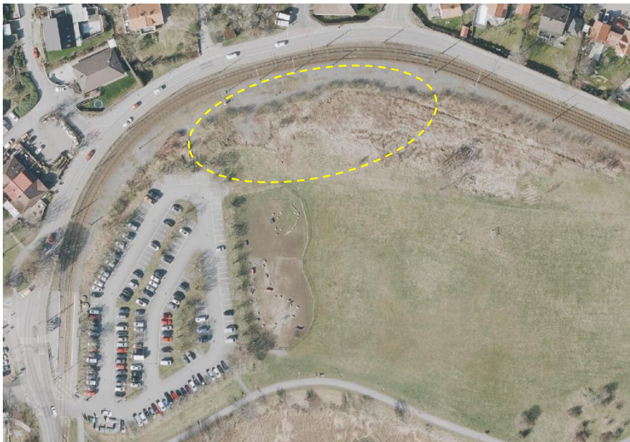
Figur 5. Befintlig parkeringsyta för besökare vid Vikebacken, med möjlighet till utbyggnad genom bygglovsansökan, se gul markering.

Idag tillhandahåller Parkeringsbolaget besöksparkeringar vid Vikebacken, där en ansökan om tillfälligt bygglov om utbyggnad avslogs av byggnadsnämnden 2020-06-23. Genom ett yrkande från D, M, L och S fick Parkeringsbolaget i uppdrag att komplettera ärendet genom att testa andra hårdgjorda ytor inom området. Parkeringsbolaget avser inkomma med en ny bygglovsansökan på ett mindre område (jämfört med tidigare ansökan) i anslutning till Vikebacken, se figur 5.