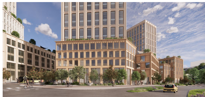
Södra byggrätten sedd från nya länken till Eriksbergsmotet