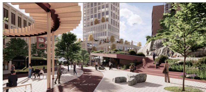
Nya busshållplatsläget och det urbana stråket genom kvarteret.