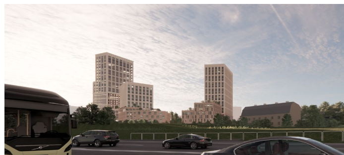
Den föreslagna bebyggelsen sedd från Lundbyleden.