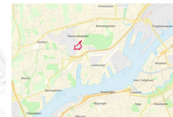
Planområdets läge i staden

Illustrationsskiss över kvarteret med högsta antal våningar angivet.