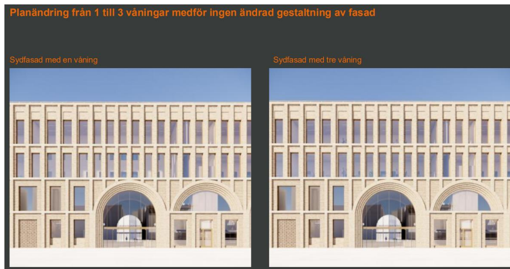
Stationsbyggnadens sydfasad, med 1 respektive 3 våningar, visande att exteriör inte påverkas.