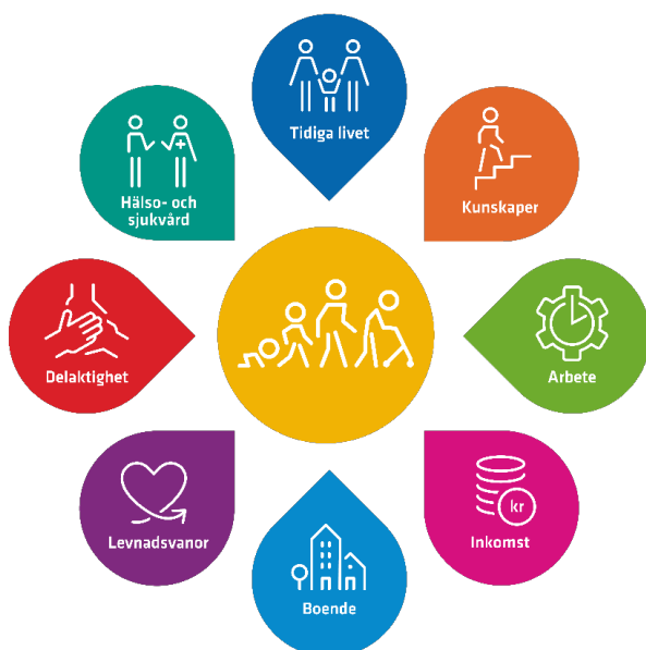
En god och jämlik hälsa – åtta målområden

Det folkhälsopolitiska ramverket delar in förutsättningarna för hälsa i åtta målområden (se figur 1 nedan). De tydliggör att arbetet för en god och jämlik hälsa måste inriktas på de bakomliggande förutsättningarna och de strukturella faktorerna som påverkar hälsa. I linje med dessa målområden och kommunens rådighet fokuserar programmet på fyra områden; barns och ungas uppväxtvillkor; delaktighet, inflytande och tillit; arbete och försörjning; samt boende och livsmiljö.