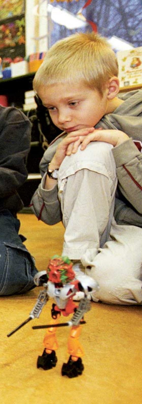
Kolla mina robotgubbar. Eleverna i klass 1B får ta med sig sina favoritleksaker och visa och berätta för kompisarna.

eller arbetslaget tillsammans en kartläggning av elevens nuvarande skolsituation. Man ringar in elevens starka sidor och de viktigaste utvecklingsmålen.