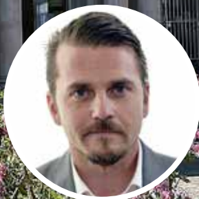
Jimmy Ståhl Riksdagsledamot