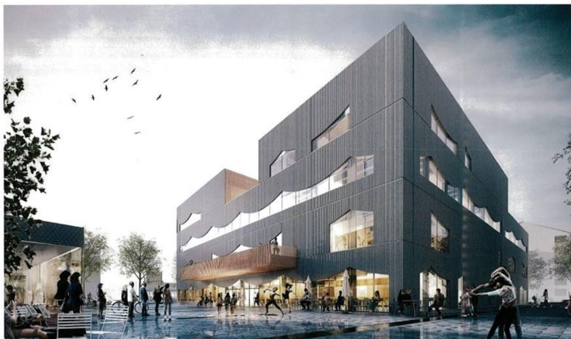
Vy från torgstråket